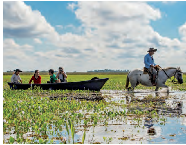
Los mariscadores eran los recolectores de cueros y plumas que vivían cazando en el interior de los esteros hacia el 1900, motivados por la fuerte demanda de pieles que determinaba la moda europea.

Es una opción ecoturística única que, sobrepasa el entorno natural, expresando la relación hombre-entorno, a través del acompañamiento de guías turísticos locales profesionales y, principalmente, del baqueano; aquel