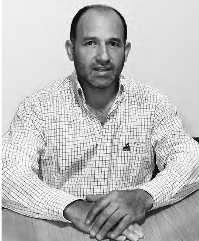
Javier Piñero: “Creo que el turismo en principio va a ser más zonal, más regional. No sé cuánta gente va a tomar la decisión de recorrer distancias grandes”.

El gobernador de la provincia de Buenos Aires, donde están la mayoría de las playas, salió a decir muy