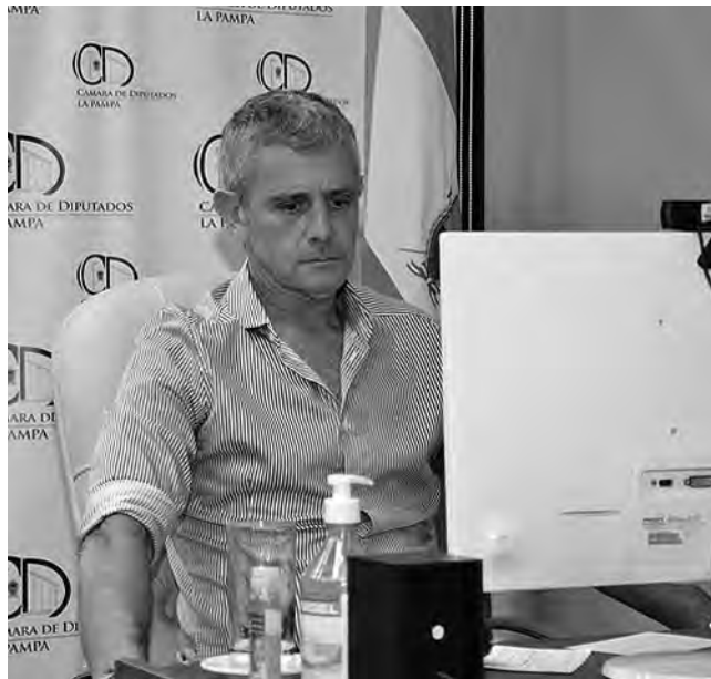
El vicegobernador de La Pampa ratificó "nuestra identidad patagónica "... "estamos consustanciados y comprometidos en el desarrollo de la integración bioceánica y la instalación definitiva del Mercosur..."

El vicegobernador ratificó "nuestra identidad patagónica y tal como lo expresáramos en oportunidad de concurrir a la sesión del Parlasur en Montevideo el pasado 11 de noviembre de 2019, cuando se trató y aprobó la Declaración de Interés del Paso Pehuenche; estamos consustanciados y comprometidos en el desarrollo de la integración bioceánica y la instalación definitiva del Mercosur en las transacciones comerciales con el sudeste asiático y los