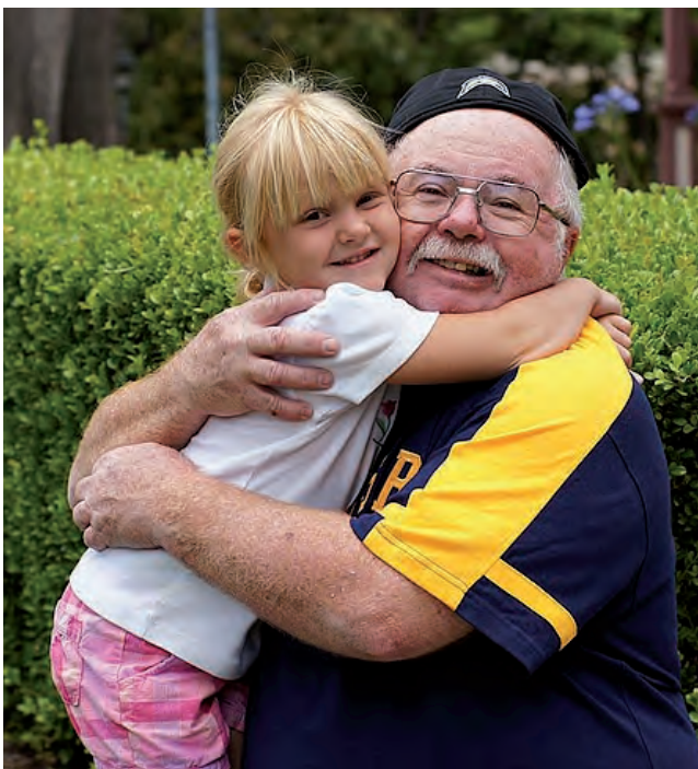
VIENE DE TAPA

Según Booking.com el año que viene será marcado por las vacaciones "mayores" ya que cada vez más abuelos se toman unas buenas vacaciones con sus nietos, dejando a la generación del medio atrás.