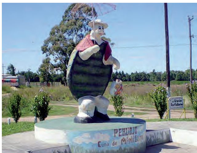
Otro clásico nacional: "Manuelita" en Pehuajó.

El mate es parte de la cultura argentina y desde 2013, oficialmente reconocido como la "infusión nacional". Descubierta por los antiguos pueblos guaraníes, la tradición de tomar mate fue transmitida a los colonizadores