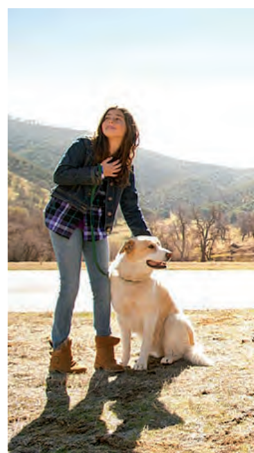
La Federación del Automóvil co más relevantes para ev

Sobrecargar el vehículo es contraproducente, dado que, por un lado, puede aumentar los niveles de consumo y exigir por de más al motor y, fundamentalmente, porque si alguno de los elementos no está asegurado como corresponde, de producirse algún tipo de impacto o incluso en una frenada brusca, éstos pueden