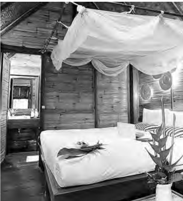
Uno de cada tres viajeros argentinos afirman que encontrar hospedajes con espacios inspiradores es uno de los factores más importantes.

La mejor solución para re decorar los ambientes de casa y generar un cambio de energía, es salir a buscar corrientes innovadoras y nuevas tendencias por el mundo. Por tal motivo, Booking.com, el líder mundial en conectar viajeros con la variedad más amplia de alojamientos, llevó a cabo una investigación en la que 1 de cada 10 viajeros argentinos admitieron que sienten "envidia" de la decoración interior de los alojamientos en los que se hospedaron durante sus vacaciones.