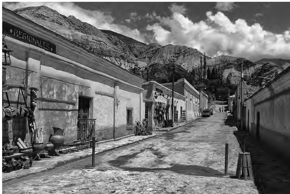
Humahuaca fue escenario de 14 batallas de la Guerra de la Independencia. Su paisaje se encuentra cobijado por la Quebrada, maravilla con reconocimiento internacional.

Por otro lado, es famosa como ciudad natal de per-