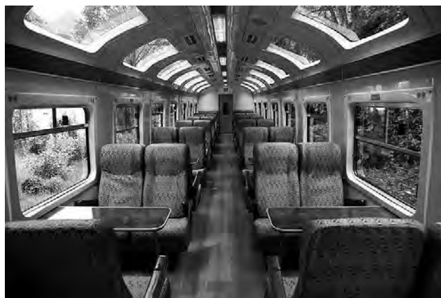
El viaje desde Cusco hasta Aguas Calientes (Machu Picchu), es mejor hacerlo en tren. No es un viaje económico, pero sí lo más aprovechable en tiempo y comodidad.

Este sitio ancestral se encuentra construido entre Huayna Picchu y la montaña Machu Picchu, las cuales se encuentran rodeadas por el río Urubamba, y otras cadenas montañosas que muestran el imponente lugar.